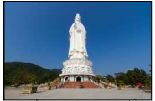
ของธาตุทั้งห้าและจิตใจของผู้คนอยู่ในที่นี่

เป็นสถานที่บูชา เจ้าแม่กวนอิมหลินอิ่งแกะสลักด้วยหินอ่อนสูงใหญ่ยืนโดดเด่นสูงที่สุดในเวียดนาม ซึ่งมีทำเลที่ตั้งดี หันหน้าออก