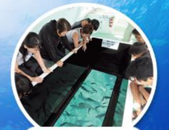
ส่งเรือกระเจก