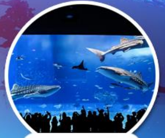
ดูราอุ่มอควาเรียม