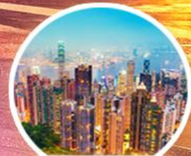
จุดชมวิว วิคตอเรียพีค