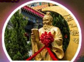
ผูกถ่ายแดง วัดหวังต้าเซียน

บินสุดหรู: กับ 5 ดาว บริการแบบ FULL SERVICE!!