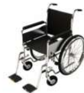
การรับการดูแลเป็นพิเศษ

กรณีผู้เดินทางต้องการความช่วยเหลือเป็นพิเศษ อาทิเช่น การใช้วีลแชร์ กรุณาแจ้งบริษัทฯ อย่างน้อย 7 วันก่อนการเดินทาง มิฉะนั้นบริษัทฯ จะไม่สามารถจัดการล่วงหน้าได้ เนื่องจาก การจองใช้วีลแชร์ในสนาม บินนั้น ต้องมีขั้นตอนในการขอล่วงหน้า และบางสายการบินอาจมีการเรียกเก็บค่าใช้จ่ายทั้งทางสนามบิน ในไทยและในต่างประเทศ ซึ่งผู้เดินทางสามารถสอบถามกับเจ้าหน้าที่ได้โดยตรงก่อนทำการจอง และหาก ในขณะของท่านมีผู้ต้องการดูแลพิเศษ เช่น ผู้ที่นั่งรถเข็น (Wheelchair), เด็ก, ผู้สูงอายุและผู้ที่มีโรค ประจำตัวหรือไม่สะดวกในการเดินทางท่องเที่ยวในระยะเวลาเกินกว่า 4 - 5 ชั่วโมงติดต่อกัน ท่านและ ครอบครัวต้องให้การดูแลสมาชิกภายในครอบครัวของตนเอง เนื่องจากการเดินทางเป็นหมู่คณะ หัวหน้า ทัวร์มีความจำเป็นต้องดูแลคณะทัวร์ทั้งหมด