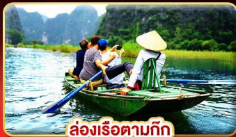
ล่องเรือตามทีก