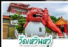
วัดเหวินหัว