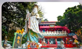
เจ้าแม่กวนอิมรัฟลส์เบย์