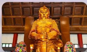
วัดเซกทมิว