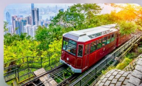
รถรางพีคแตรม