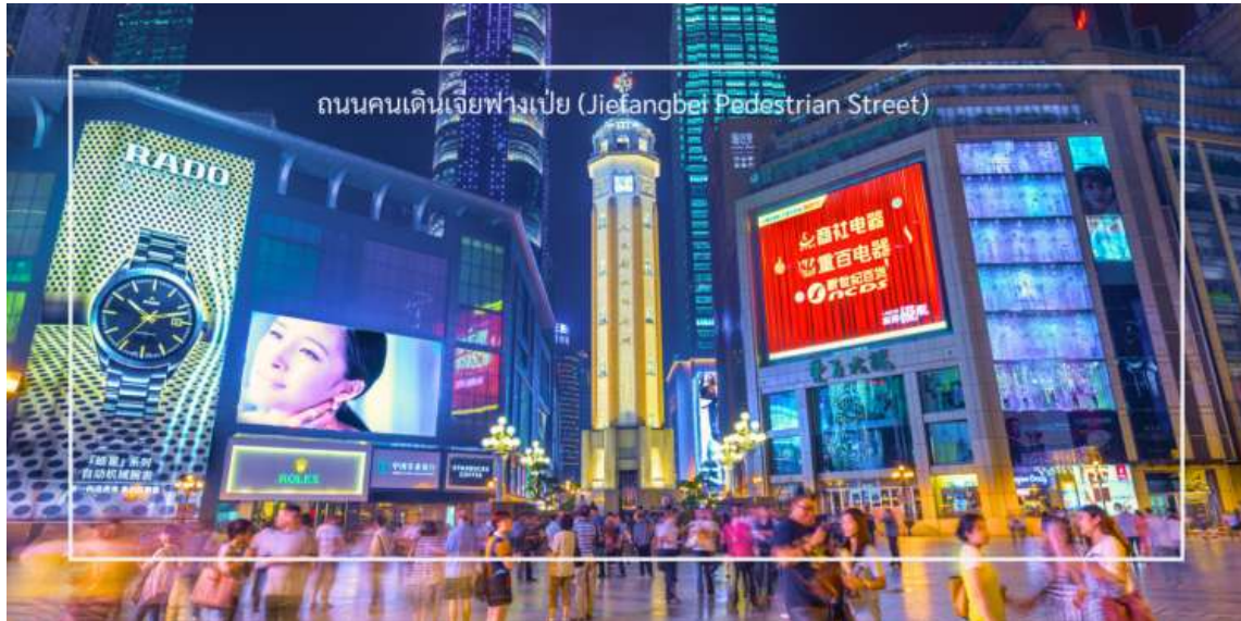
ถนนคนเดินเจียงเป่ย์ (Jiefangbei Pedestrian Street)