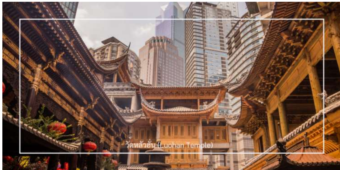
วัดหลัวอัน (Luohan Temple)

นำท่านเที่ยวชม วัดหลัวอัน (Luohan Temple) หรือที่เรียกว่า "วัดอรหันต์" เป็นวัดที่มีชื่อเสียงในเมืองฉงชิ่ง (Chongqing) มีประวัติศาสตร์ยาวนานและมีความสำคัญในด้านศาสนาพุทธ วัดหลัวอันมีพระพุทธรูปและรูปปั้นอรหันต์จำนวนมาก ซึ่งเป็นที่เคารพนับถือของผู้มาเยือน นอกจากนี้ยังมีบริเวณที่ให้ผู้เข้าชมสามารถทำบุญและสวดมนต์