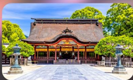
ศาลเจ้าคาโซฟู

BEPPU หรือเทียบเท่ามาตรฐานญี่ปุ่น FUKUOKA หรือเทียบเท่ามาตรฐานญี่ปุ่น FUKUOKA หรือเทียบเท่ามาตรฐานญี่ปุ่น