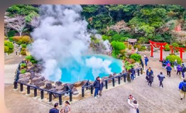
บ่อน้ำพุร้อนยูมิ จิโกกุ