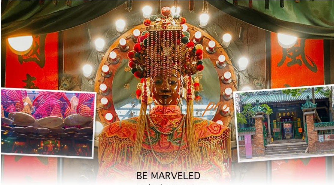
BE MARVELED วัดเจ้าแม่ทับทิมกินหัว

นำท่านเดินทางสู่ วัดกวนไท หรือที่คนไทยนิยมเรียกว่า "วัดเทพเจ้ากวนอู" เป็นสถานศักดิ์สิทธิ์อันเลื่องชื่อ ถือว่าเป็นวัดแห่งเดียวในเขตเกาลูน ที่สร้างขึ้นเพื่อบูชา เทพเจ้ากวนอู ซึ่งท่านเป็นเทพเจ้าแห่งความซื่อสัตย์ เปี่ยมไปด้วยคุณธรรม โดยศาลเจ้าพ่อกวนอูแห่งนี้ ผู้ที่มาไหว้สักการะจะนิมขอพรเรื่องธุรกิจและบิรวาร เนื่องจากว่าเจ้าพ่อกวนอู เป็นเทพเจ้าที่รักษาคำพูดด้วยชีวิต รักคุณธรรม ซื่อสัตย์ ช่วยปกป้องสิ่งเลวร้าย อันตรายต่าง ๆ และช่วยเสริมอำนาจบารมีในการปกครอง ท่านมีจิตใจมั่นคงตั้งขุนเขา มีสติปัญญาเป็นเลิศ และไม่ประมาท ท่านจึงเป็นสัญลักษณ์แห่งความเข้มแข็งโดดเด่น ไม่ครั้นคร้ามต่อศัตรู ฉะนั้นการมาบูชาขอพรท่าน จะช่วยเสริมดวงไม่ให้เพื่องพลา้แก่ศัตรู ทำให้มีมิตรที่ซื่อสัตย์ และคุ้มครองบิรวารให้ก้าวหน้าและอยู่เย็นเป็นสุข ซึ่งผู้ประกอบการอาชีพ ตำรวจ ทหาร และ นักการเมือง จึงมักจะนิมบูชาเทพเจ้ากวนอู เป็นพิเศษ