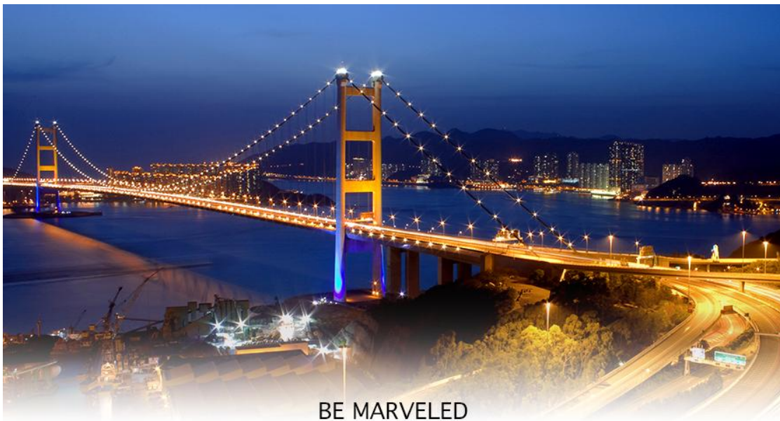
BE MARVELED สะพานแขวนซิงหม่า

17.40 น. เดินทางถึง สนามบินเช็กแล็บก๊อ (CHEK LAP KOK INTERNATIONAL AIRPORT) เขตปกครองพิเศษฮ่องกง หลังผ่านพิธีการตรวจคนเข้าเมืองเป็นที่เรียบร้อยแล้ว รับกระเป๋าสัมภาระ เดินทางโดยรถโค้ชปรับอากาศ (เวลาที่ท้องถิ่นที่ฮ่องกง เร็วกว่าประเทศไทย 1 ชั่วโมง)