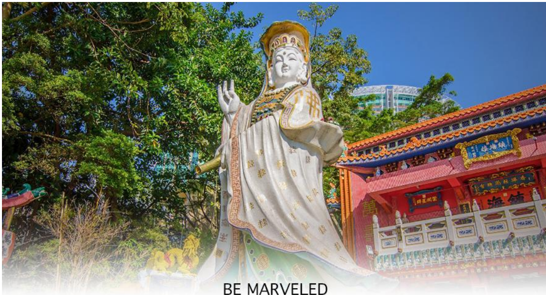
BE MARVELED วัดเจ้าแม่กวนอิมริพัลส์เบย์

สถานที่ท่องเที่ยวที่สำคัญ สร้างขึ้นในปี ค.ศ.1993 มีรูปปั้นของ เจ้าแม่กวนอิม ปางประทานพรตั้งอยู่ ซึ่งคนฮ่องกงและคนจีนให้ความเคารพนับถือมากที่สุด เชื่อว่าเป็นเทพที่มีความศักดิ์มากขอพรเรื่องการทำงานการเงิน และขอพรขอโชคขอลาภเพื่อเป็นสิริมงคล และขอพร เจ้าแม่ทับทิม หรือ เทพธิดาแห่งท้องทะเล ซึ่งทำหน้าที่ปกป้องคุ้มครองชาวประมง ตั้งโดดเด่นอยู่ท่ามกลางสวนสวยที่ทอดยาวลงสู่ชายหาดให้ท่านนมัสการขอ และนำท่านเดินข้าม สะพานต่ออายุ ซึ่งเชื่อกันว่าข้ามหนึ่งครั้งจะมีอายุเพิ่มขึ้น 3 ถ้าข้ามแล้วห้ามเดินย้อนกลับไปเด็ดขาด เพราะคนฮ่องกงเชื่อว่าชีวิตจะสั้นลงไป 3 ปี สำหรับคนโตจะนิยมขอพรกับ เทพเจ้าแห่งความรัก ให้เอามือคูบที่บริเวณหินสีดำ พร้อมกับอธิษฐานให้สมหวังกับความรัก ปิดท้ายด้วยการรับพลังฮวงจุ้ยจาก ศาลา แผลทิส ซึ่งถือเป็นจุดรวมพลัง ถือเป็นจุดที่มีฮวงจุ้ยดีที่สุดในเกาะฮ่องกง และยังมีรูปปั้นองค์เทพอีกมากมายภายในวัดแห่งนี้ให้กราบไหว้ขอพร