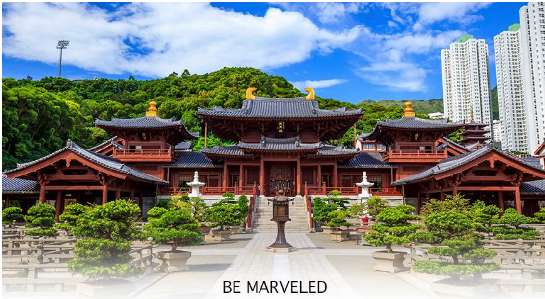
BE MARVELED วัดซีหลิน

กลางน้ำ ร้านน้ำชา ร้านขายของที่ระลึก คาเฟ่ กังหันน้ำ น้ำตก ถือว่าเป็นสวนสาธารณะท่ามกลางตึกสูงของเมือง Pavilion of Absolute Perfection ศาลาจีนทรงแปดเหลี่ยมสีทองที่ตั้งอยู่กลางสระบัว เป็นอีกหนึ่งไฮไลต์ของที่นี่ เพราะเป็นจุดที่นักท่องเที่ยวนิยมมาถ่ายรูป ศาลานี้เป็นสัญลักษณ์ของความสมบูรณ์ในทุกด้านของชีวิต