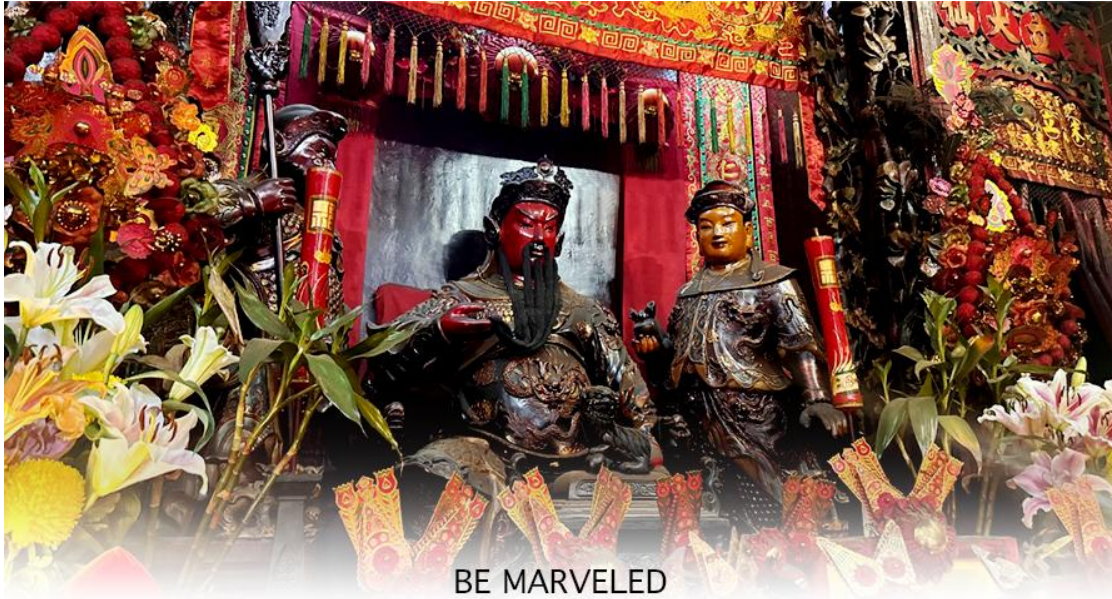
BE MARVELED วัดกวนอู