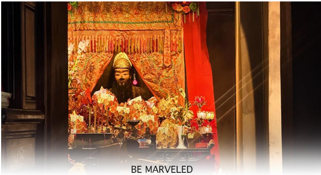
BE MARVELED วัดเข่ง 600 ปี

นำท่านเดินทางสู่ วัดเข่ง 600 ปี ที่ตั้งอยู่ในไซกุง เขต New Territories เป็นวัดเก่าแก่ริมแม่น้ำโฮซุง ไม่ไกลจากปากอ่าว และท่าเรือ เป็นวัดสำคัญในหมู่บ้านโฮซุง ซึ่งมีทั้งหมู่บ้านเก่า และหมู่บ้านที่ตั้งใหม่ (New Village) แวดล้อมด้วยภูเขาสูงใหญ่ โดยรอบ มีแม่น้ำโฮซุงไหลผ่านหมู่บ้านออกไปยังปากอ่าว โดยแม่น้ำสายนี้จะไหลมาจากยอดเขาในไซกุงที่ถือว่าเป็นจุด The best hiking แห่งหนึ่งของฮ่องกง นอกจากนี้จะมีอายุถึง 600 ปี