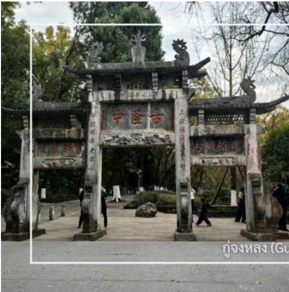
กุหลองจง (Gulongzhong)

หลังอาหารเช้านำท่านสู่ กุหลองจง (Gulongzhong) แหล่งท่องเที่ยวทางประวัติศาสตร์และวัฒนธรรมที่มีชื่อเสียง ตั้งอยู่ใกล้เมืองเซียงหยาง เป็นสถานที่พำนักของ จูกัดเหลียง (ซงเป้ง) นักปราชญ์และนักยุทธศาสตร์ผู้ยิ่งใหญ่แห่งยุคสามก๊ก สถานที่แห่งนี้ในอดีตคือสถานที่ที่เล่าไปได้เดินทางมาพบกับจูกัดเหลียงที่เชิญตัวไปร่วมทัพ ปัจจุบันสถานที่นี้โอบล้อมด้วยธรรมชาติ สะท้อนบรรยากาศแห่งการศึกษา และวางแผนการเมืองในอดีต พร้อมให้ท่านได้เรียนรู้เรื่องราวทางประวัติศาสตร์อันทรงคุณค่า พร้อมสัมผัสบรรยากาศที่เชื่อมโยงกับตำนานและภูมิปัญญาจีนโบราณ จึงนับเป็นจุดหมายสำคัญสำหรับผู้สนใจประวัติศาสตร์ยุคสามก๊ก และวัฒนธรรมจีน