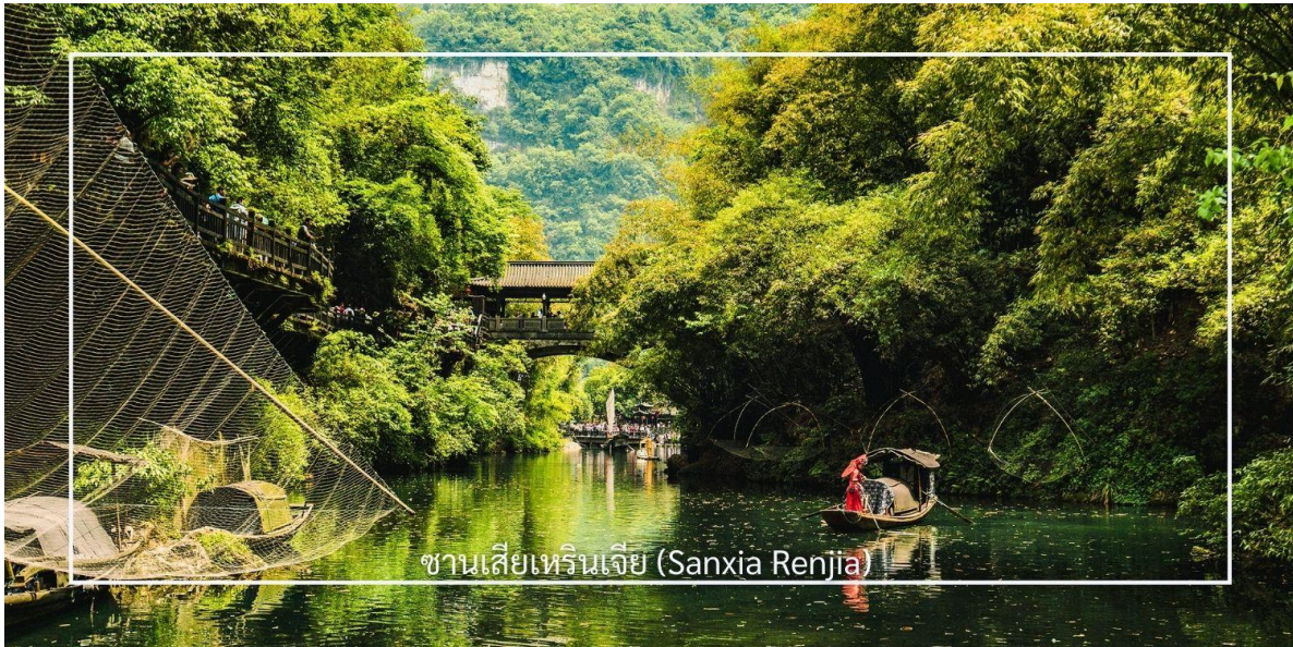
ซานเซียเหรินเจีย (Sanxia Renjia)

นำท่านสู่ หมู่บ้านซานเซียเหรินเจีย (Sanxia Renjia) (รวมต่องเรือ) สถานที่นี้เป็นที่รู้จักกันในชื่อ หมู่บ้านสามผา แหล่งท่องเที่ยวระดับ 5A ตั้งอยู่ในเขตหุบเขาสามผา ริมแม่น้ำแยงซีเกียง โดดเด่นด้วยทัศนียภาพทางธรรมชาติอันงดงามของภูเขา หินผา สายน้ำ และหุบเขาที่โอบล้อมกันอย่างกลมกลืน สถานที่แห่งนี้สะท้อนวิถีชีวิตดั้งเดิมของชาวลุ่มแม่น้ำแยงซีเกียง ผ่านสถาปัตยกรรมพื้นบ้าน วัฒนธรรม ประเพณี ที่ยังคงเอกลักษณ์ไว้อย่างครบถ้วน พร้อมให้ท่านได้ชมการแสดงเรื่องราวเกี่ยวกับวิถีชีวิตควบคู่กับสายน้ำ