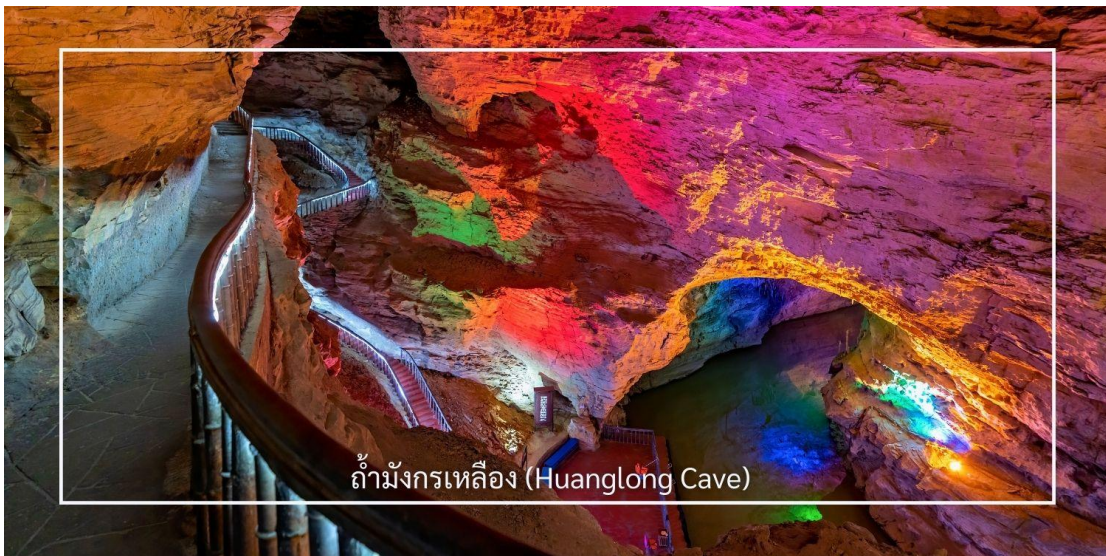
ถ้ำมังกรเหลือง (Huanglong Cave)

ถ้ำมังกรเหลือง หนึ่งในถ้ำหินงอกหินย้อยที่ยิ่งใหญ่และงดงามที่สุดของเมืองจางเจี๋ย แหล่งท่องเที่ยวทางธรรมชาติที่ได้รับการยกย่องว่าเป็น “พระราชวังใต้พิภพ” แห่งดินแดนอู่หลิงหยวน ถ้ำแห่งนี้มีโครงสร้างขนาดใหญ่ แบ่งออกเป็น 4 ชั้น ภายในประกอบด้วยห้องโถงกว้างใหญ่ ลำธารใต้ดิน บึงธรรมชาติ และแนวระเบียงหินที่ทอดยาวอย่างน่าตื่นตา ความมหัศจรรย์ของหินงอกหินย้อยซึ่งก่อตัวสะสมมาเป็นเวลาหลายล้านปี ได้รับการจัดแสงอย่างสวยงาม ช่วยขับเน้นรูปร่างแปลกตาให้โดดเด่น ราวงานศิลป์จากธรรมชาติ สัมผัสประสบการณ์ ล่องเรือชมแสงสีภายในถ้ำ โดยเรือจะนำท่านลัดเลาะไปตามสายน้ำใต้ถ้ำให้ท่านได้สัมผัสกับความยิ่งใหญ่ของธรรมชาติอันน่าอัศจรรย์ได้อย่างใกล้ชิด