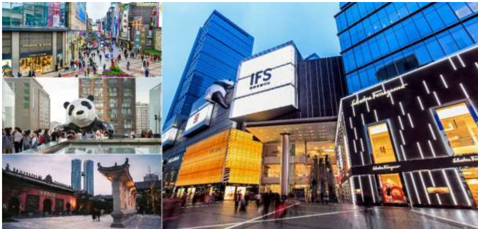
อิสระอาหารค่ำ ตามอัธยาศัย

นำท่านชมจุดเช็คอินที่ หมี่แพนด้ายักษ์ปิ่นตึก (IFS BUILDING) เป็นแพนด้าที่อ้วนน่ารักกำลังปิ่นปายตึก เป็นประติมากรรมแพนด้ายักษ์แขวนอยู่บนอาคาร IFS ในใจกลางเมืองเจิงตู