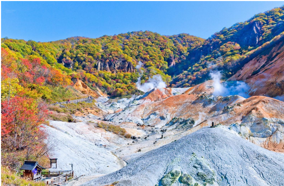
ค่ำ บริการอาหาร ณ ห้องอาหารโรงแรม