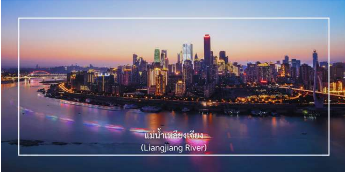
แม่น้ำเหลียงเจียง (Liangjiang River)

เย็น บริการอาหารเย็น ณ ภัตตาคาร (มื้อที่ 9) เมนูพิเศษ : ชาบูหม่าล่า