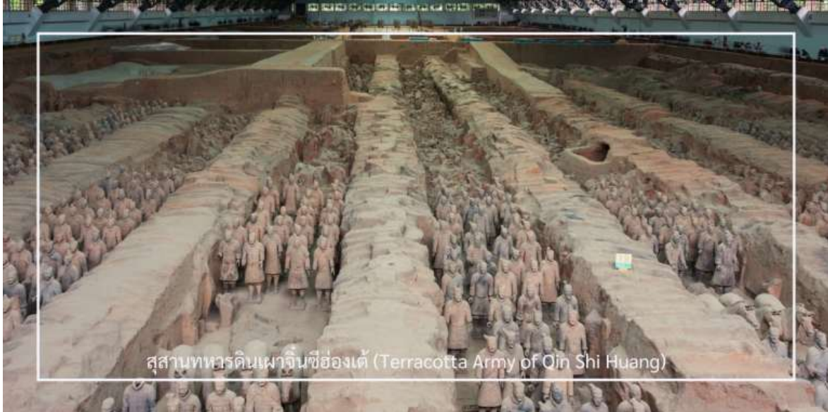
สุสานทหารดินเผาจีนซีฮ่องเต้ (Terracotta Army of Qin Shi Huang)

อย่างประณีต มีใบหน้า ท่าทาง และเครื่องแต่งกายแตกต่างกันไป พร้อมด้วยรถศึก ม้า และอาวุธโบราณ ที่วางเรียงราย อย่างเป็นระเบียบในหลุมฝังศพ เพื่อปกป้องจักรพรรดิในชีวิตรหลังความตาย