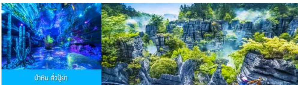
ป่าหิน ส่วป๋วย่า

รับประทานอาหารเช้า ณ ห้องอาหารของโรงแรม (10)