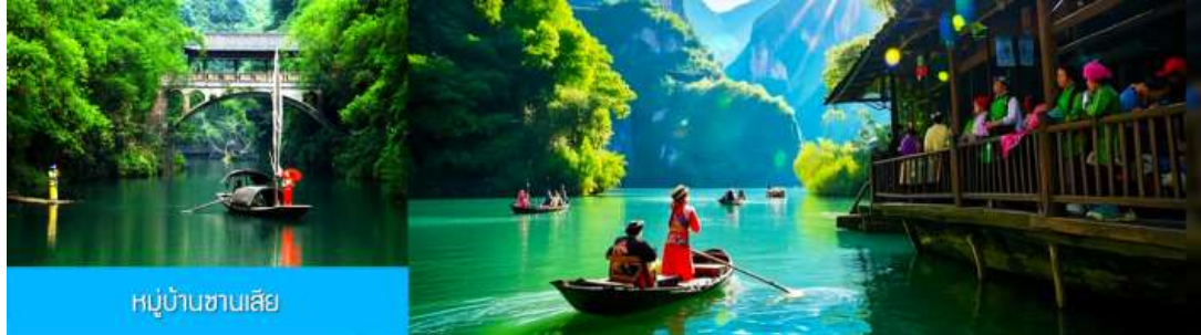
หมู่บ้านซานเสี