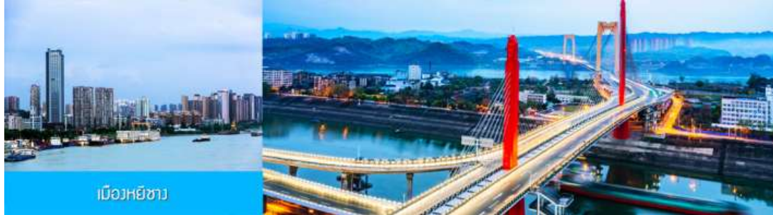
เมืองหยี่ซาง

วันแรก ทำอากาศยานสุวรรณภูมิ – เมืองหยี่ซาง