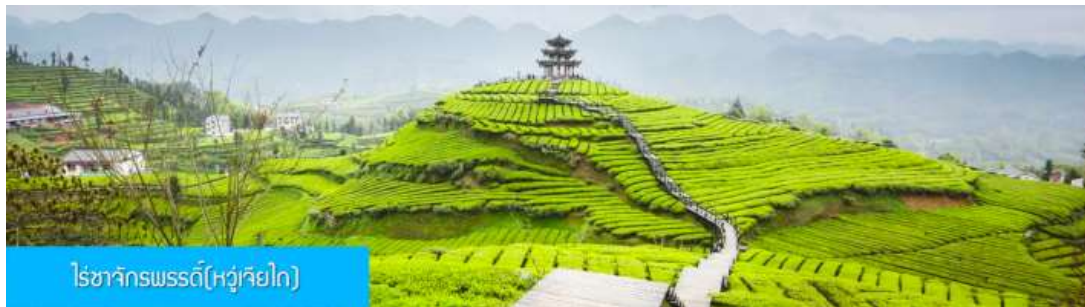
ไร่ชาจักรพรรดิ(หู่เจียโถ)

รับประทานอาหารเช้า ณ ห้องอาหารของโรงแรม (4)