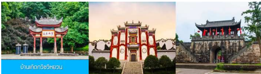
บ้านเกิดกวีชวีหยวน

พักที่ XIAZHOU HOTEL OR HONGQIAO HOTEL ระดับ 4 ดาวห้องดีนหรือเทียบเท่าในเมืองหยีซาง