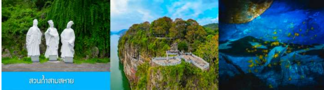
สวนเก้าสามสหาย