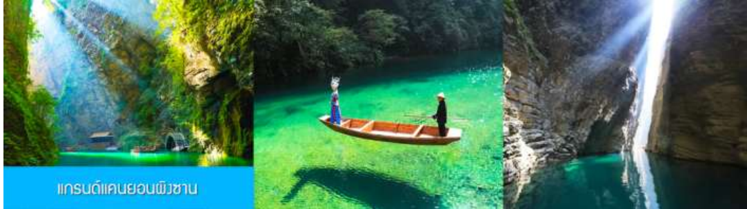
แกรนด์แคนยอนผิงซาน