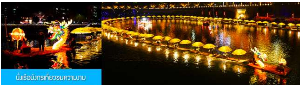
นั่งเรือมังกรเที่ยวชมความงาม

หลังอาหารนำท่านเดินทางเข้าที่พัก ไคตี้นำเสนอโปรแกรมเสริม เป็น โปรแกรม นั่งเรือมังกร เที่ยวชมความงามของบ้านเรือนและสิ่งปลูกสร้างสองฝั่งแม่น้ำในช่วงที่สวยงามที่สุดของเมือง เฉียนเฉิน ที่ประดับประดาด้วยแสงสี และได้ชื่อว่าเป็น วิวยามค่ำคืนที่สวยงามที่สุดในมณฑลหูเป่ย์ เช่นเดียวกับเมืองโบราณฟางหวงในมณฑลหูหนาน..... อัตราค่าบริการสำหรับโปรแกรมเสริมนั่งเรือมังกรชมวิวยามค่ำคืน ท่านละ 190 หยวน หรือ 950 บาท ระยะเวลาที่ใช้ในการเรือมังกร ประมาณ 45 นาที ค่าบริการรวม ค่าบัตรเข้าชม ค่ารถรับ ส่ง และค่าน้ำเที่ยวของไคตี้ท้องถิ่น