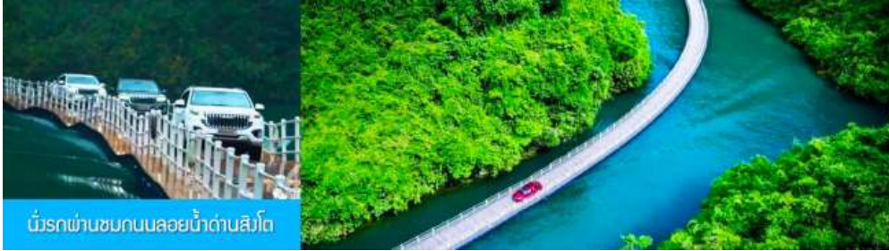
นั่งรถผ่านชมถนนลอยน้ำต้าบสิงโต

หลังอาหารนำท่านเดินทางโดยรถบัสสู่เมือง เฉียนเฉิน 宣恩市 (ระยะทาง 112 กม ใช้เวลาเดินทางราว 1 ชั่วโมงครึ่ง) ระหว่างทาง ไคตี้ท้องถิ่นนำเสนอขบวนโปรแกรมเสริม จุดนั่งรถผ่านชมถนนลอยน้ำต้าบสิงโต 獅子关 อุทยานท่องเที่ยวที่กลายเป็นจุดเช็กอินยอดนิยมของเมืองเฉียนเฉิน เคยเป็นจุดตั้งด่านป้องกันการโจมตีของข้าศึก และเป็นด่านเก็บภาษีสินค้าในอดีต ด้วยลักษณะภูมิประเทศที่เป็นทางสัญจรในช่องแคบที่มีผาหินสูงชันมีรูปร่างคล้ายสิงโตเป็นปราการ เหมาะแก่การตั้งด่านสกัด จึงได้รับการขนานนามเป็นด่านสิงโตที่เป็นหนึ่งในสามด่านสำคัญของมณฑลหูเป่ย์ในอดีต.....ไฮไลท์ของการเที่ยวอุทยานคือการ นั่งรถเล่นผ่านสะพานลอยน้ำความยาว 9 กม. เป็นสะพานที่ใช้ทุ่นลอยน้ำที่ร้อยเรียงเป็นแนวยาวเหนือน้ำ ได้สะพานไม่มีมือค้ำยัน ระหว่างที่รถวิ่งผ่านสะพานท่านจะได้สัมผัสวิวทิวทัศน์ที่สวยงามสองฝั่งสะพานและน้ำสีเขียวมรกต..... อัตราค่าบริการสำหรับโปรแกรมท่องเที่ยวอุทยาน ด่านสิงโต ท่านละ 300 หยวนหรือ 1,500 บาท รวมค่าบัตรเข้าอุทยาน ค่ารถอุทยานผ่านชมถนนลอยน้ำ ค่ารถรับ ส่ง ไปยังอุทยาน รวมเวลาท่องเที่ยวและเดินทางไป กลับ ราว 2 ชั่วโมงเศษ