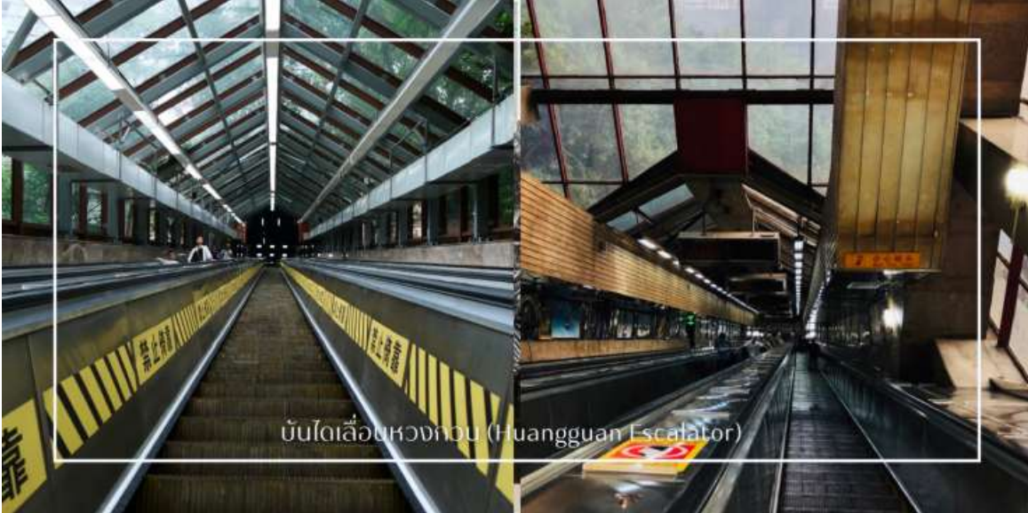
บันไดเลื่อนหวงกั๋ว (Huangguan Escalator)

เที่ยง บริการอาหารเที่ยง ณ ภัตตาคาร (มื้อที่8) เมนูพิเศษ : สุกี้หม่าล่า