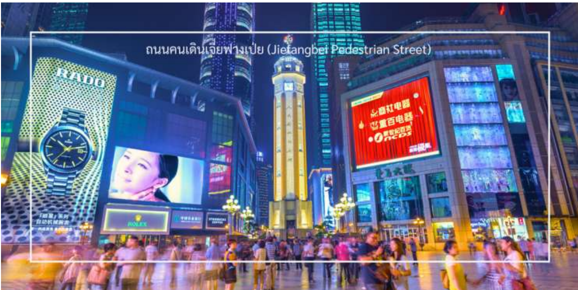
ถนนคนเดินเจี๋ยฟางเป่ย์ (Jiefangbei Pedestrian Street)

จากนั้นนำท่าน อีสระซ้อปั้ง ถนนคนเดินเจี๋ยฟางเป่ย์ (Jiefangbei Pedestrian Street) ที่แห่งนี้เป็นหนึ่งในแหล่ง ซ้อปั้งและท้องเที่ยวที่สำคัญที่สุดในเมืองฉงชิ่ง (Chongqing) เป็นพื้นที่ที่มีชีวิตชีวาและคึกคัก มีร้านค้า ร้านอาหาร และสถานบันเทิงมากมาย ถนนสายนี้มีบรรยากาศที่มีชีวิตชีวา และยังเต็มไปด้วยร้านค้าแบรนด์เนม ร้านค้าท้องถิ่น และตลาดที่ขายสินค้าต่างๆ เช่น เสื้อผ้า เครื่องประดับ และของที่ระลึก แวะชมร้าน POP MART ร้านดังจากจีน ที่รวมฟิกเกอร์ดีไซน์เก๋และตุ๊กตาน่ารักหลากหลายซีรีส์ยอดนิยม เช่น Molly, Dimoo, Labubu และอีกมากมาย