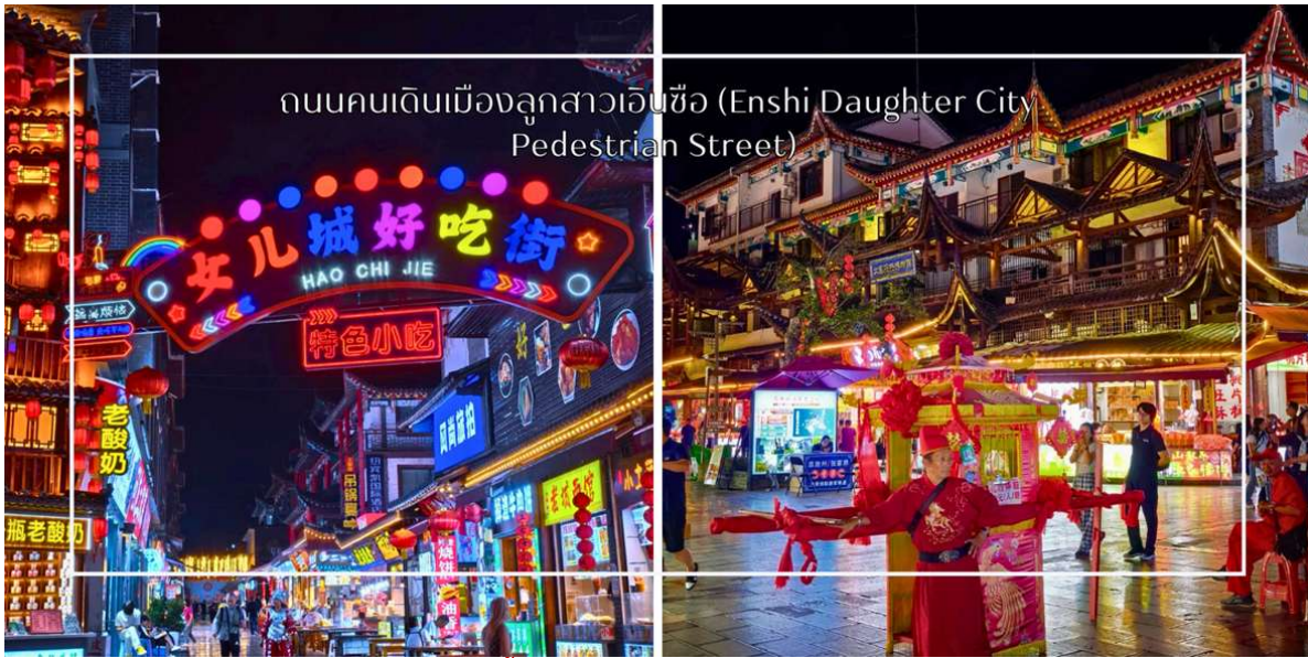
ถนนคนเดินเมืองลูกสาวเินซือ (Enshi Daughter City Pedestrian Street)

สมควรแก่เวลานำท่านสู่ ถนนคนเดินเินซือ (Enshi Daughter City Pedestrian Street) หรือเรียกอีกชื่อ ถนนคนเดินเมืองลูกสาวเินซือ เป็นศูนย์กลางกิจกรรมท้องถิ่นที่เต็มไปด้วยสีสันและวัฒนธรรมของเินซือ ถนนเส้นนี้เต็มไปด้วยร้านค้า ร้านอาหาร และแผงขายสินค้าพื้นเมือง ทั้งของฝาก งานหัตถกรรม และอาหารท้องถิ่น ทำให้นักท่องเที่ยวได้สัมผัสวิถีชีวิตของคนท้องถิ่นอย่างใกล้ชิด บรรยากาศในยามค่ำคือน่าชมมีชีวิตชีวา แสงไฟประดับถนนสวยงามตัดกับภูมิทัศน์เมืองเก่า และมีมุมถ่ายภาพสวยๆ ให้ผู้มาเยือนได้เก็บความประทับใจ