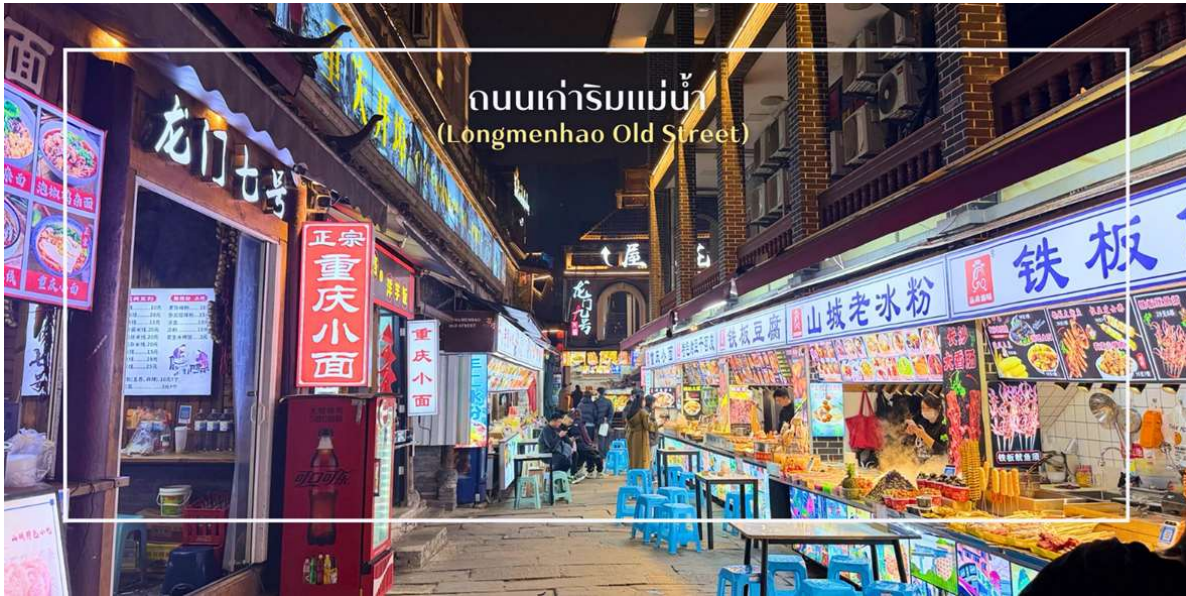
ถนนเก่าริมน้ำ (Longmenhao Old Street)

เย็น บริการอาหารเย็น ณ ภัตตาคาร (มีที่ 9) เมนูพิเศษ : สุกี้หม่าล่า