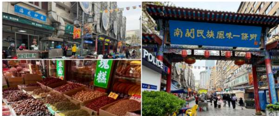
ถนนคนเดินเซี่ยหนานกวน

สมควรแก่เวลานำทุกท่านเดินทางสู่สนามบิน เพื่อทำการเช็คอินกับสายการบิน