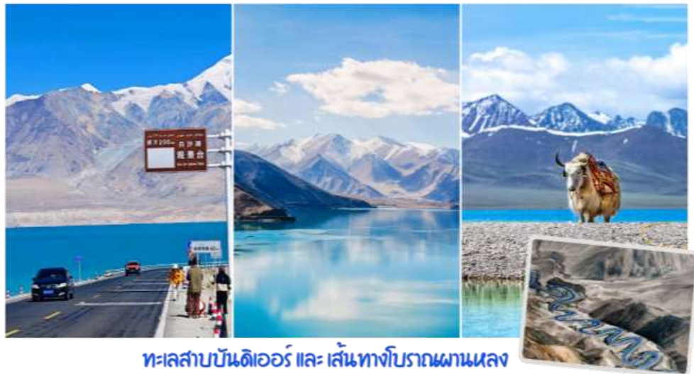
ทะเลสาบบันดิเออร์ และ เส้นทางโบราณผานหลง

นำท่านสู่ ถนนเส้นทางโบราณผานหลง (Panlong Ancient Road) ตั้งอยู่บนที่ราบสูงพามีร์ (Pamir Plateau) เขตเมืองทาชกูร์กัน (Taxkorgan) ทางตอนใต้ของเขตปกครองตนเองซินเจียงอุยกูร์ ประเทศจีน ถนนบนภูเขาที่คดเคี้ยวเลี้ยวตลอดอันตระการตาในเขตปกครองตนเองทาชกูร์กัน (Taxkorgan) ทางตอนใต้ของซินเจียง ประเทศจีน มีฉายาว่า "ถนนมังกรขด" ขึ้นชื่อเรื่องโค้งหักศอกกว่า 600 โค้ง บนภูเขาสูงชัน เป็นแลนด์มาร์กสำคัญสำหรับสายถ่ายภาพและคนรักการเดินทางที่ต้องการท้าทายฝีมือการขับขี ให้ทัศนียภาพที่สวยงามและแปลกตาของแนวภูเขาสูงชันและทะเลทรายในเขตซินเจียง จากนั้นนำท่านเปลี่ยนรถเป็นรถ 7 ที่นั่ง เพื่อเดินทางสู่ ทะเลสาบบันดิเออร์ ทะเลสาบบันดิร์ (Bandir Blue Lake) หรือ อ่างเก็บน้ำเซียบันดี (Xiabandi Reservoir) เป็นทะเลสาบสีฟ้าครามใสมหัศจรรย์ที่ตั้งอยู่ท่ามกลางเทือกเขาพามีร์ ในเขตปกครองตนเองซินเจียงอุยกูร์ ประเทศจีน ขึ้นชื่อเรื่องวิวธรรมชาติที่สวยงามราวกับภาพวาดและน้ำสีฟ้าเข้มอันเป็นเอกลักษณ์จากการละลายของน้ำแข็ง น้ำสีฟ้าเทอร์ควอยซ์ตัดกับเทือกเขาสีน้ำตาลและท้องฟ้าสีคราม เป็นจุดถ่ายภาพที่ยอดนิยมในเส้นทางชมธรรมชาติบนที่ราบสูงพามีร์