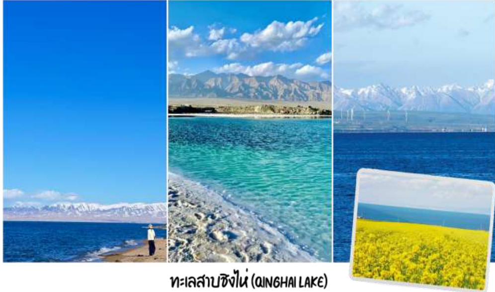
ทะเลสาบชิงไห่ (QINGHAI LAKE)

หลังจากนั้นนำท่านสู่ ถนนคนเดินลี่เหมิง (Liming Walking Street) ตั้งอยู่ในเขตซีหนิง (Xining) มณฑลชิงไห่ ประเทศจีน เป็นแหล่งช้อปปิ้งและท่องเที่ยวที่เป็นที่นิยม โดยเป็นจุดเช็คอินในทัวร์เส้นทางสายวัฒนธรรมทิเบตและซินเจียง-ซีหนิง ขึ้นชื่อเรื่องการจำหน่ายสินค้าท้องถิ่น ของที่ระลึก และอาหารพื้นเมืองสไตล์ตะวันตกเฉียงเหนือของจีน เป็นถนนที่คึกคัก เหมาะสำหรับการเดินชมวิถีชีวิตชาวท้องถิ่น เลือกซื้อของฝาก และสัมผัสวัฒนธรรมอาหารของชาวจีนมุสลิมและชาวทิเบตที่ผสมผสานกันในเมืองซีหนิง ให้ท่านได้ลิ้มลองอาหารท้องถิ่น เช่น เนื้อแกะย่าง, โยเกิร์ตชิงไห่, ขนมแป้งทอด และซื้อสินค้าหัตถกรรม