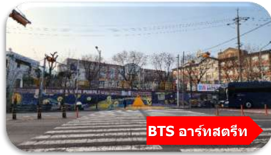
BTS อาร์ตสตรีท

นำท่านเที่ยวชม ตลาดชอมุน (Seomun Market) ตลาดพื้นเมืองชื่อดัง ที่มีประวัติยาวนานตั้งแต่สมัยโชซอน และถือเป็นหนึ่งในตลาดดั้งเดิมที่ใหญ่ที่สุดของเกาหลีใต้ ภายในเต็มไปด้วยของกินสตรีทฟู้ด ร้านผ้า เสื้อผ้า ของฝาก และบรรยากาศท้องถนนแบบเกาหลีแท้ ๆ ไฮไลท์ห้ามพลาดคือ "ตลาดกลางคืน" ที่คึกคักไปด้วยอาหารพื้นเมืองสุดอร่อย เช่น มันดู แป้งเกี้ยวแบน และดอกบกกี