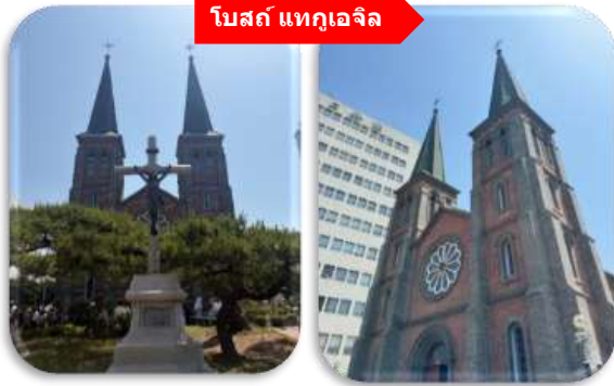
โบสถ์ แทกูเจอลึ

นำท่านเที่ยวชม โบสถ์แทกูเจอลึ โบสถ์นิกายโปรเตสแตนต์ที่เก่าแก่ที่สุดใน จังหวัดคย็องซังบุก (Gyeongsangbuk-do) ตั้งอยู่ในบริเวณ Cheongna ซึ่งเป็นย่านที่อยู่อาศัยของเหล่ามิชชันนารีที่มาอาศัยอยู่ใน เมืองแทกู