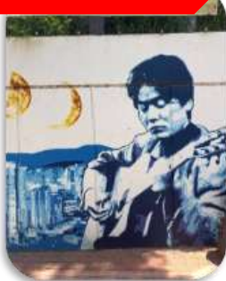
ถนนคิมควังซอก

นำท่านเที่ยวชม ถนนคิมควังซอก เป็นถนนสายเล็ก ๆ สดอบอุ้นในเมืองแทกู ที่สร้างขึ้นเพื่อระลึกถึง คิมควังซอก นักร้องโฟล์กในตำนานของเกาหลีใต้ ผู้เกิดที่แทกูและเป็นศิลปินที่คนเกาหลียังคงรักมากจนถึงทุกวันนี้ เดิมทีบริเวณนี้เป็นกำแพงเก่าใต้ทางรถไฟ แต่ภายหลังถูกพัฒนาให้กลายเป็น "ถนนแห่งเสียงเพลงและความทรงจำ" ตลอดทางจะเต็มไปด้วยภาพวาดกราฟฟิตี้ รูปปั้นของคิมควังซอก งานศิลปะและมุมถ่ายรูปแนววินเทจ เส้นโค้งของถนนนี้ไม่ใช่ความอลังการ แต่เป็นความรู้สึก "อบอุ่นและมีเรื่องราว" คาเฟ่ ร้านดนตรี และบรรยากาศชยอนยุค