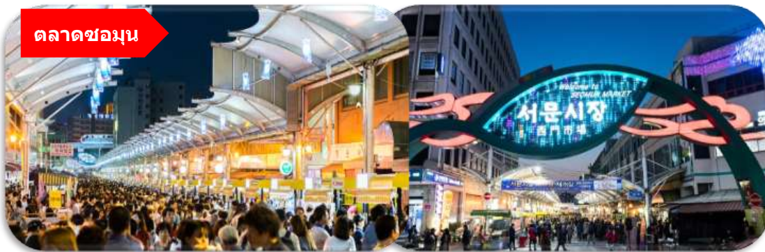
ตลาดชอมุน

นำท่านเที่ยวชม ตลาดชอมุน (Seomun Market) ตลาดพื้นเมืองชื่อดัง ที่มีประวัติยาวนานตั้งแต่สมัยโชซอน และถือเป็นหนึ่งในตลาดดั้งเดิมที่ใหญ่ที่สุดของเกาหลีใต้ ภายในเต็มไปด้วยของกินสตรีทฟู้ด ร้านผ้า เสื้อผ้า ของฝาก และบรรยากาศท้องถนนแบบเกาหลีแท้ ๆ ไฮไลท์ห้ามพลาดคือ "ตลาดกลางคืน" ที่คึกคักไปด้วยอาหารพื้นเมืองสุดอร่อย เช่น มันดู แป้งเกี้ยวแบน และดอกบกกี