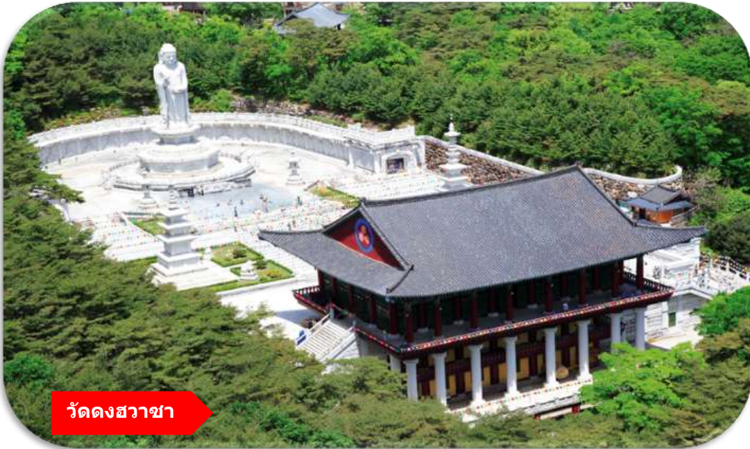
วัดดงสวาชา