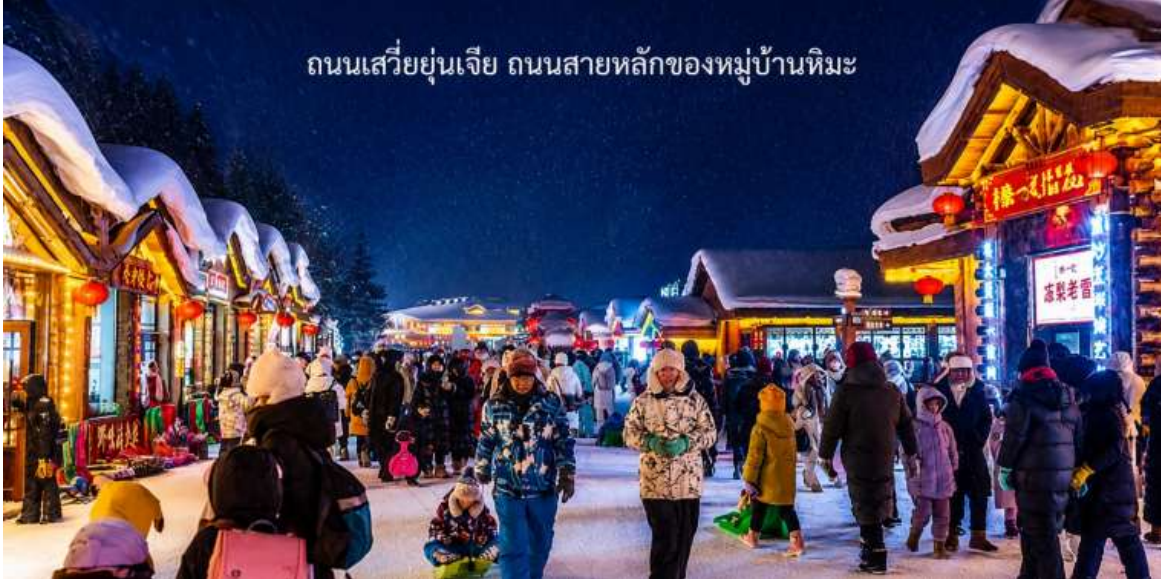
ถนนเสวี่ยยู่่นเจีย ถนนสายหลักของหมู่บ้านหิมะ

เดินทางเข้าสู่ที่พักในหมู่บ้านหิมะ Xuexiang (GAO LAOWU MINSU) ที่พักสไตล์มาตรฐานท้องถิ่น