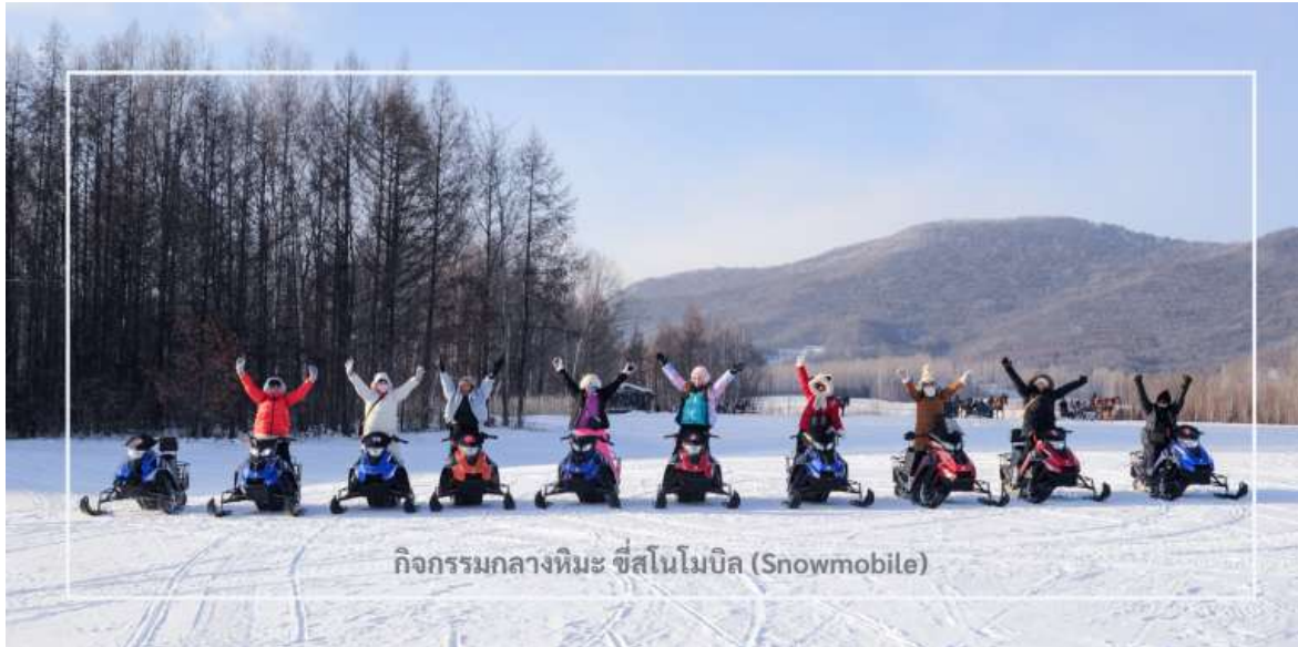
กิจกรรมกลางหิมะ ซีสนโมบิล (Snowmobile)

สมควรแก่เวลานำท่านเดินทางสู่เมือง มู่ตันเจียง (Mudanjiang) ใช้เวลาเดินทางประมาณ 2 ชั่วโมง มู่ตันเจียง เมืองสำคัญตั้งอยู่ใกล้พรมแดนรัสเซีย ห่างไปทางตะวันตกประมาณ 110 กิโลเมตร เมืองนี้มีเอกลักษณ์วัฒนธรรม และสถาปัตยกรรมที่ผสมผสานระหว่างรัสเซียและจีน โดยเฉพาะในฤดูหนาวเมืองจะถูกปกคลุมด้วยหิมะขาวโพลน