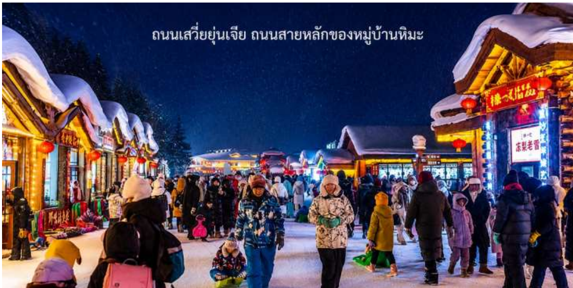
ถนนเสวียยูนเจีย ถนนสายหลักของหมู่บ้านหิมะ

นอกจากนี้ยังมีกิจกรรมเดินเขากลางคืน ทั้งภูเขาถูกประดับไฟ ส่องสว่างไสวสวยงามทั้งคืน เดินทางตามบันได เชื่อมไปจนถึงระเบียงทางเดิน ที่จะทำให้ท่านเห็นความงามของหมู่บ้านในยามค่ำคืนจากมุมสูง นำท่านเดินชมบรรยากาศบนถนนเสวียยูนเจีย ถนนสายหลักของหมู่บ้านหิมะ ที่เต็มไปด้วยร้านค้าของที่ระลึก ร้านอาหารท้องถิ่น และร้านกาแฟน่ารัก ๆ ถนนสายนี้ถูกตกแต่งด้วยไฟประดับและโคมแดงสไตล์จีน เพิ่มเสน่ห์ให้บรรยากาศอบอุ่นและมีชีวิตชีวา ท่านสามารถช้อปปิ้งสินค้าแฮนด์เมด พร้อมถ่ายภาพเก็บความทรงจำในมุมสวย ๆ ของหมู่บ้าน