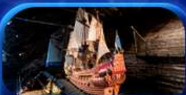
พิพิธภัณฑ์ชาวชา

Scandinavian Lover Capital Sweden Norway Denmark