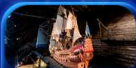
พิพิธภัณฑ์ชาวชา

Scandinavian Lover Capital Sweden Norway Denmark