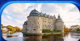
ปราสาทไอโรโบ