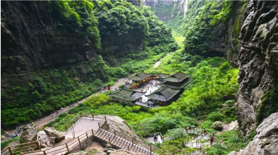
กลางวัน รับประทานอาหารกลางวัน ณ ถัดตาคาร (มื้อที่ 3)