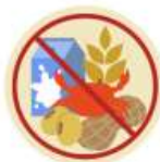
● แห่อาหาร / อื่นๆโปรดระบุ