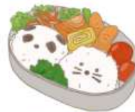
● อาหารสำหรับเด็ก ( 2-11 ปี ) *วัตถุดิบขึ้นอยู่กับทวาราน